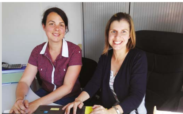
EPSMS VALLÉE DU LOCH À GRAND-CHAMP (MORBIHAN)

La Rochelle, journées de formation nationales de l'association ANDICAT.