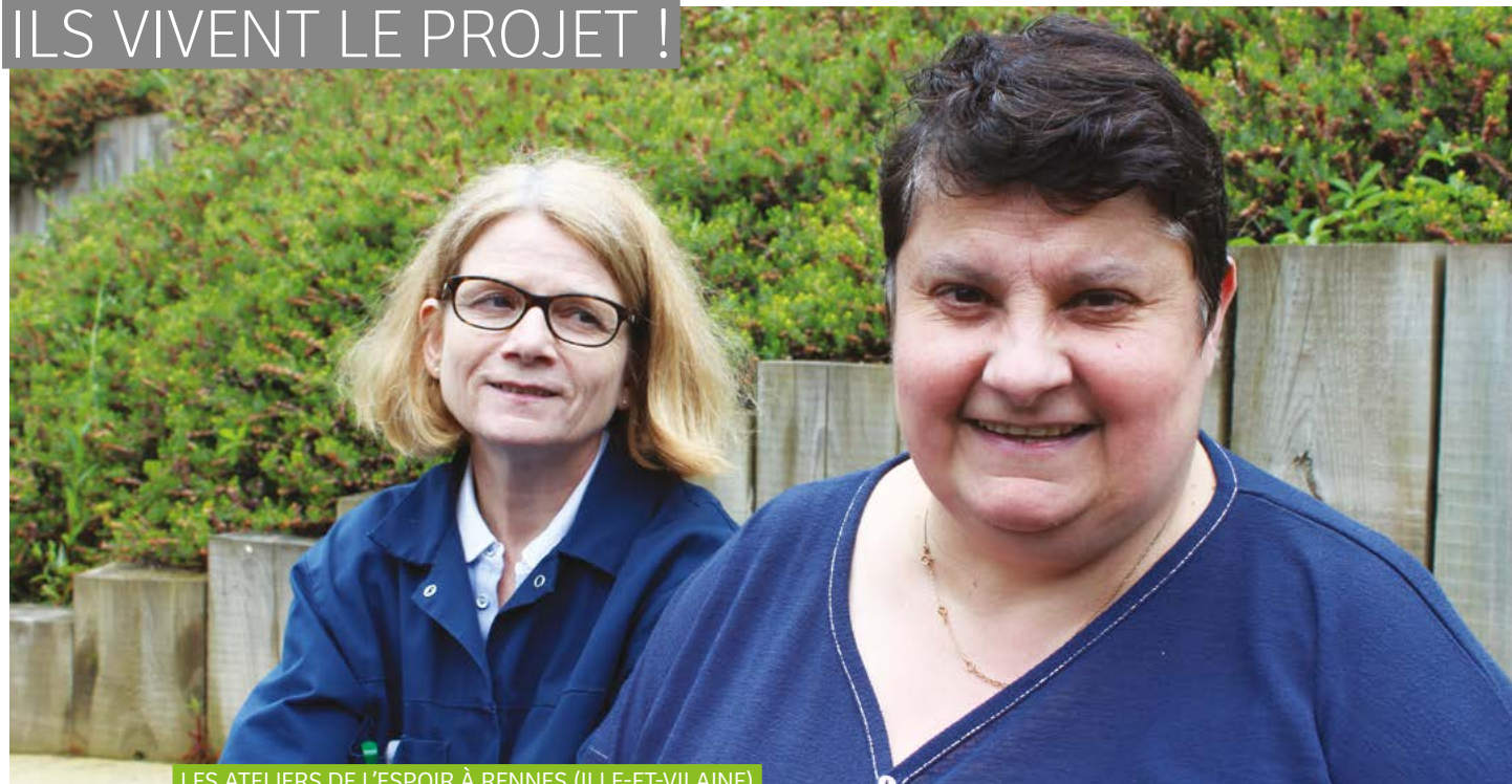
LES ATELIERS DE L'ESPOIR À RENNES (ILLE-ET-VILAINE)